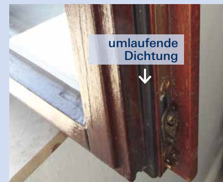
Holz- oder Kunststofffenster mit Isolierglas, mit mindestens einer umlaufenden Dichtung