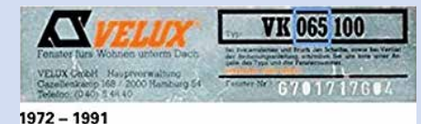
Bild 5/6: Dachflächenfenster, z. B. von Velux Baujahr bis 1991 mit z. B. diesen Typenschildern